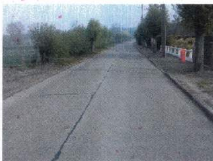
Vue de la rue du Soleil